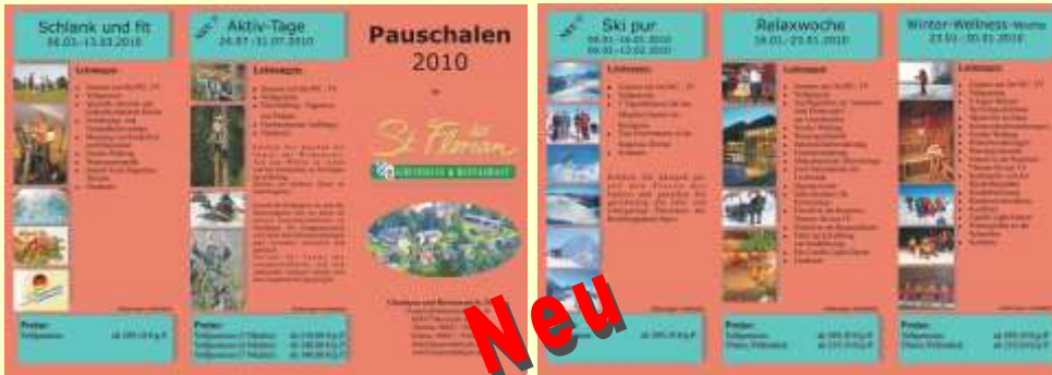
Flyer mit den Leistungen der verschiedenen Pauschalwochen

Für das kommende Jahr haben wir wieder interessante und vor allem günstige Pauschalwochen für Sie zusammengestellt.