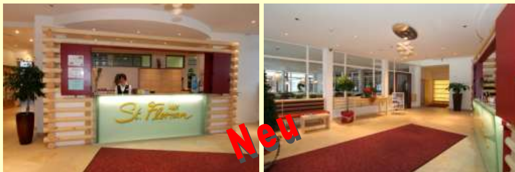
Verschiedene Ansichten der Rezeption und der Lobby

Nach über eineinhalb-jähriger Bauzeit konnten die neuen Räume Ende Dezember 2008 von den Gästen bezogen werden. Die ersten Eindrücke unserer Gäste waren sehr positiv. Inzwischen sind die Bar, der Wintergarten, der Gästeaufzug und eine ganztägig besetzte Rezeption schon fast zur Selbstverständlichkeit geworden. Schon bei der Ankunft fallen die neuen Anbauten ins Auge. In der großzügigen Lobby und einer extravaganter Rezeption werden die Gäste von freundlichen Damen im Dirndl empfangen. Der Check-In verläuft freundlich und schnell. Die ankommenden Gäste erhalten ihre Zimmerschlüssel, die Gastkarten, ihre Tischnummer und weitere Informationen für ihren Urlaub.